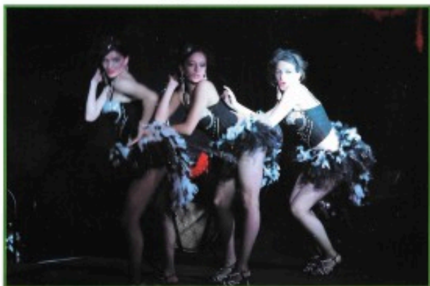
La compagnie l'Indipen'danse